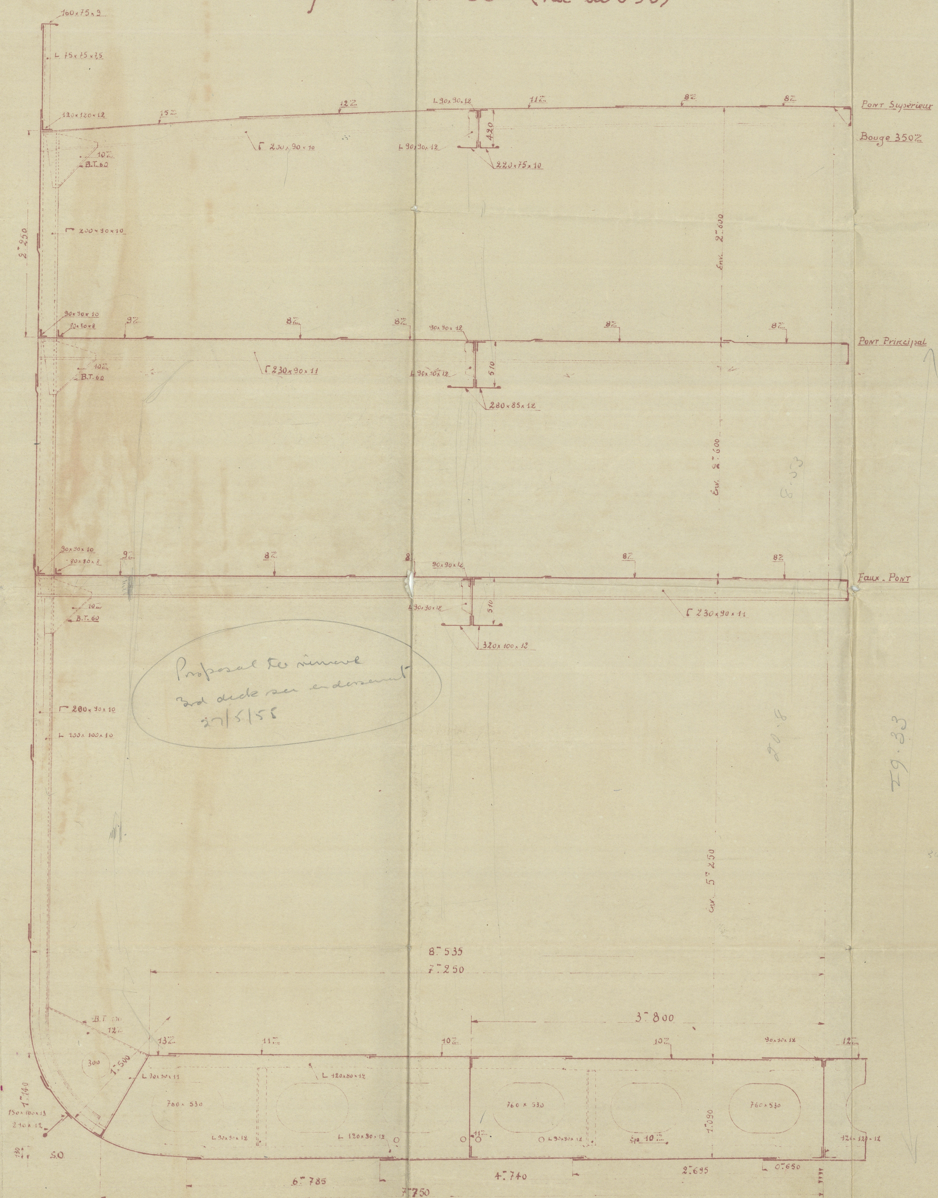
Coupe au c. 95 (rue de l'N)