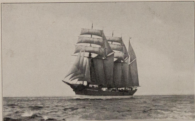
Fünfmast-Segelschoner „Christel Vinnen“ Baujahr 1922